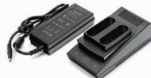
バッテリー・チャージャ