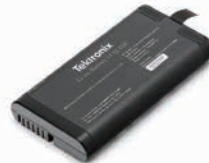
2-BP用スペア・バッテリー