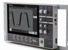
ラックマウント・キット *本体は含まれません