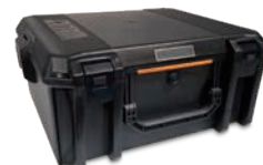
ハード・キャリング・ケース